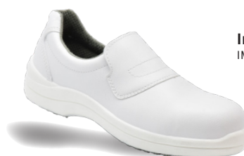
Impala Femme S2 SRC IMPFS20BL